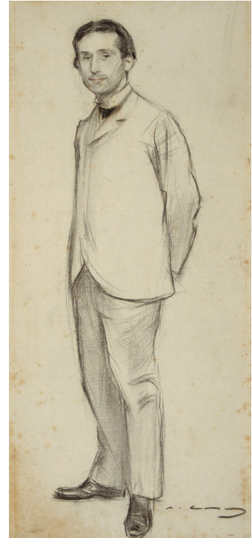
Retrat de Pompeu Fabra, de Ramon Casas. MNAC.