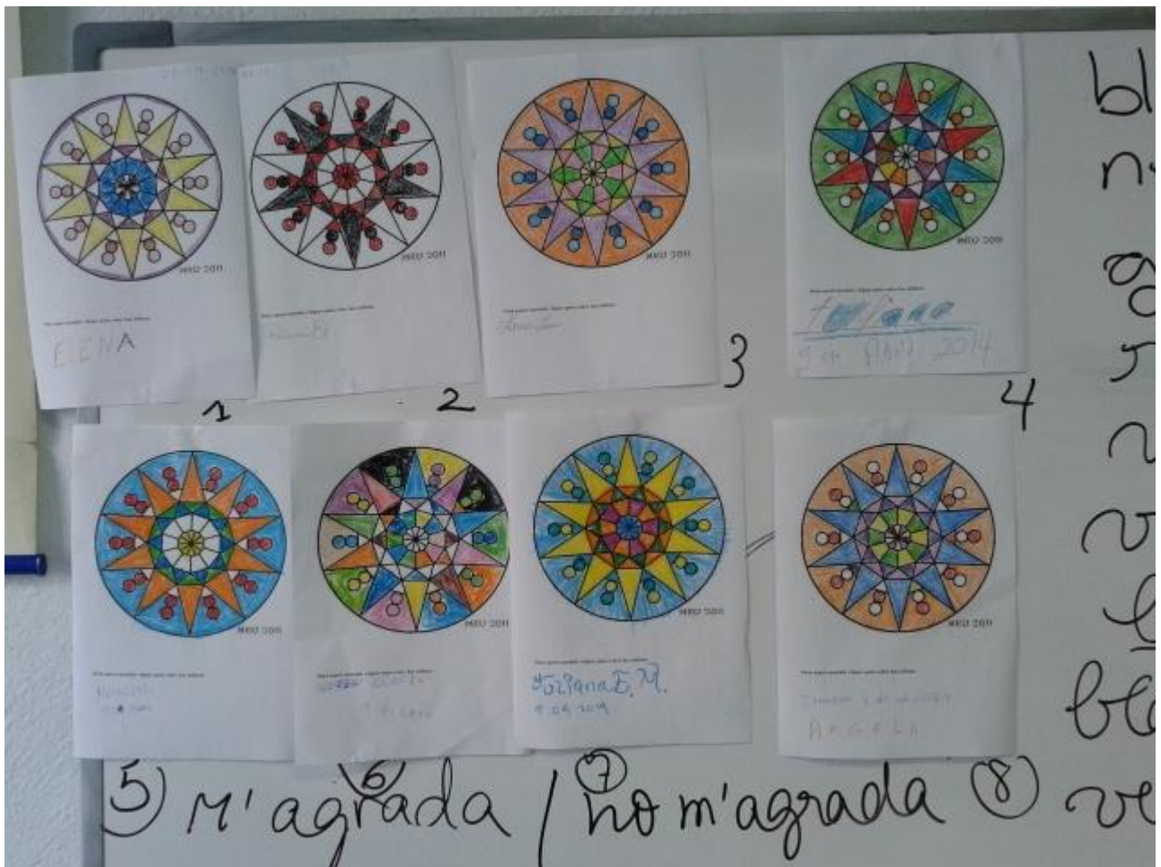
Fotografia 2: Detall de tots els mandales decorats i numerats per al concurs ( núm.7 guanyadora)